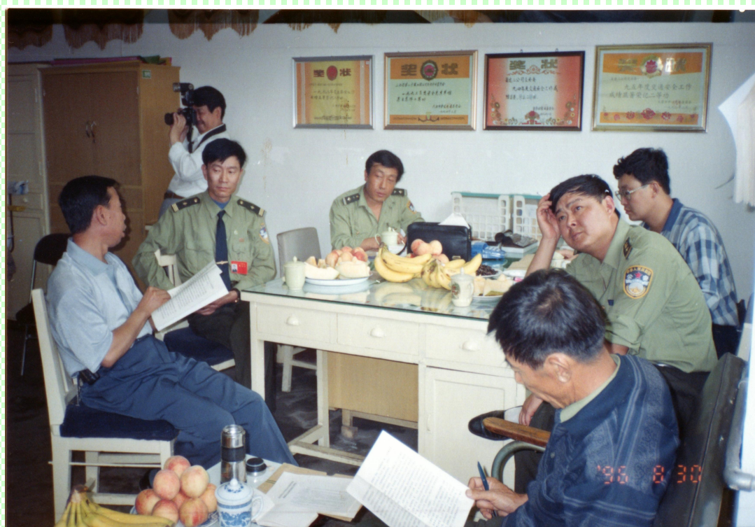
图为武乡县公安局交通警察大队组织当地企业到二公司参观学习

我过去的梦想，是学会电脑，学会打字，学会制作电子表格。那是 1993 年的事情，已经整整过去三十年了。